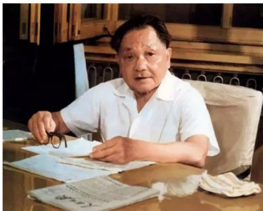
邓小平经常阅读人民日报，并多次为人民日报改稿

1964年10月16日，中国第一颗原子弹爆炸成功，人民日报印发喜报。当天，这份“新中国第一份彩色号外”一报难求，无数双手伸向空中接收号外的镜头被永远定格。