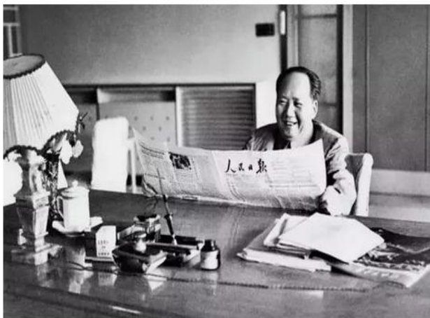
1961年，毛泽东在杭州阅读人民日报

人民有信仰，国家有力量，民族有希望。让党的主张成为亿万人民的自觉行动，让亿万人民的力量汇聚成实现民族复兴的伟力，这是人民日报的使命，也是人民日报的担当。